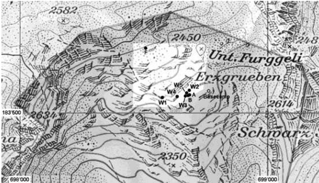
Kartenausschnitt des oberen Teils der Zone W. Der aktuelle Sektor hell mit der Lage der Höhlen W1-W5