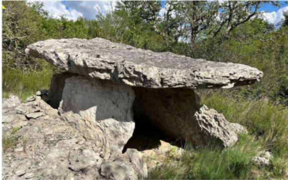
Einer der Dolmen von Bourbouillet, DGW

Nach dem Besuch der Höhle wuschen wir unsere Kombis im Fluss aus und machten noch einen kurzen Abstecher zu den Dolmen von Bourbouillet.