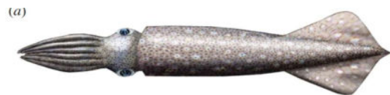
Rekonstruktion des Belemniten-artigen Tintenfisches Acanthoteuthis aus dem deutschen Oberjura (Klug et al. 2016).

Der erste Kilometer der Höhle, welche in der Commune de St. André de Cruzières liegt, wurde bereits zwischen 1830 und 1850 durch Jules de Malbos erkundet. Inzwischen ist das imposante Höhlensystem auf beachtlichen 14'500 m erforscht, Teile davon sind jedoch nur tauchend zu befahren. Die Höhle ist in massigen Kalken des Oxfordiums (Später Jura, ca. 157 Millionen Jahre alt; Cohen et al. 2013) angelegt. Die hellen Kalke führen gelegentlich Fossilien wie Belemniten, deren dunkelgraue kalzitische Rostren hier und da aus den Wänden wittern (vergleiche Wisshak & Klug 1997). Belemniten werden auch Donnerkeile oder Teufelsfinger genannt und gehören zum Innenskelett ausgestorbener, zehnamiger Tintenfische. An diesen kalzitischen Rostren waren die Flossen dieser Tintenfische befestigt (Klug et al. 2016).