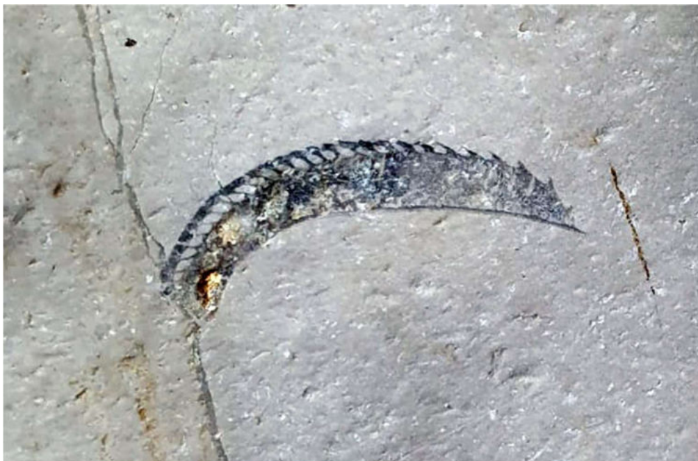
Querschnitt durch einen Lamellaptychus in der Grotte de Côtalière.

Doch nun zur Höhle! Der Gangquerschnitt ist am Eingang sehr schlank hochoval. Die Höhe erscheint besonders beeindruckend durch einen am Eingang liegenden, etwa sechs Meter hohen, bei der Befahrung glücklicherweise trockenen Wasserfall. Durch eine Reihe von Metallritten ist dieser jedoch leicht zu erklimmen. Die ersten 300 Meter bieten keinerlei Hindernisse und führen oft über sandigen Boden durch wunderschöne Druckröhren in den Aven de la Cocalhère.