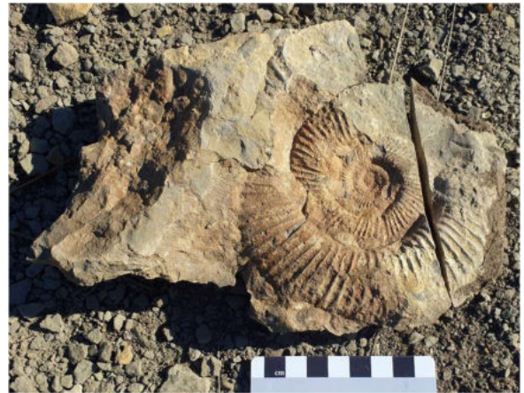
Ein hübscher Dichotomosphinctes aus dem Oxfordien neben der ehemaligen Bahntrasse bei Saint-Paul-Le-Jeune, entdeckt von Doro.

Doch nun zur Höhle! Der Gangquerschnitt ist am Eingang sehr schlank hochoval. Die Höhe erscheint besonders beeindruckend durch einen am Eingang liegenden, etwa sechs Meter hohen, bei der Befahrung glücklicherweise trockenen Wasserfall. Durch eine Reihe von Metallritten ist dieser jedoch leicht zu erklimmen. Die ersten 300 Meter bieten keinerlei Hindernisse und führen oft über sandigen Boden durch wunderschöne Druckröhren in den Aven de la Cocalhère.