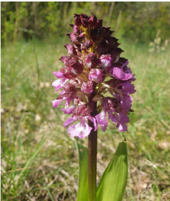
Ein prächtiges Knabenkraut am Wegrand, welches leider kurz später von Touristen geklaut wurde.