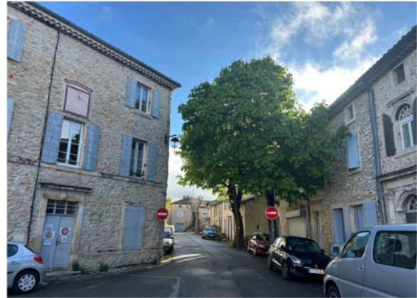
Das Dorf Saint-Remèze, DGW

Der Name "Bartade" leitet sich möglicherweise vom okzitanischen Wort "barade" ab, was "Umfassungsmauer" bedeutet, oder von "bartasse", einer Bezeichnung für dichtes Gestrüpp – passend zur versteckten Lage der Höhle, was sie zu ihrem Schutz auch bleiben soll.