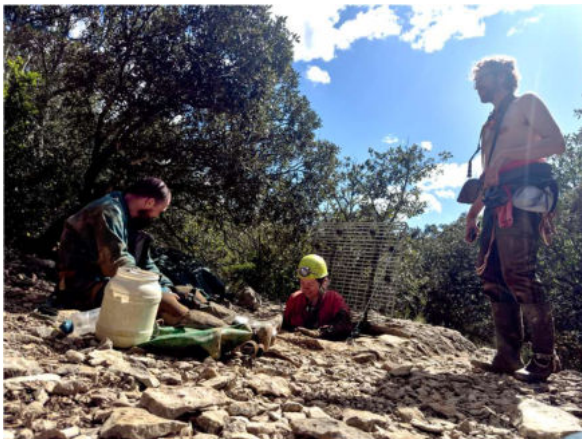
Vor dem Eingang, MFa

Nach einer Stunde Fahrt erhielten vom „Verwalter“ den Code für das Zahlenschloss am Eingang. Umziehen und Ausrüsten mit den Kletterutensilien.