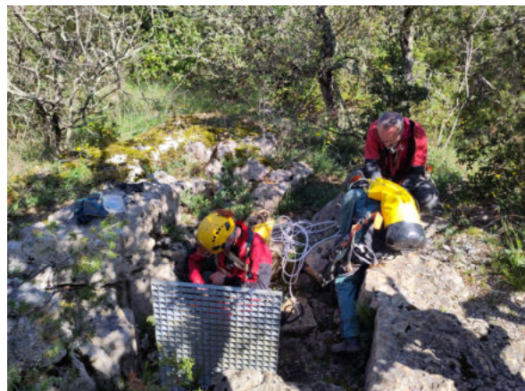
Schachteinstieg der Event de Peyrejal, GG