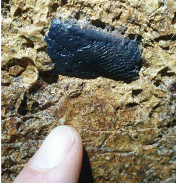
Herausgewitterter Lamellaptychus in der Grotte de Côtalière, die charakterischen Rippen zeigend. Die gerade, obere Kante entspricht der Artikulation, an der die andere Hälfte des symmetrischen Unterkiefers ansetzte.

Die Schichten des Oxfordien führen eine sehr vielfältige Kopffüßerfauna, ganz ähnlich wie im Schweizer Jura wie beispielsweise in Holderbank (Ottiger 2014).