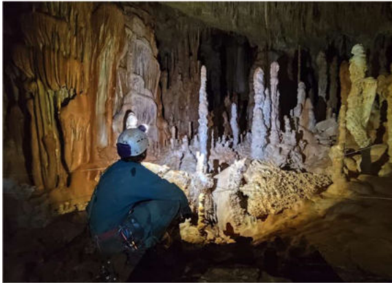
Halle in der Grotte de Estavan, LZ