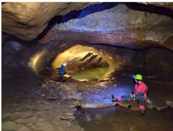
Im Hauptgang, MFa

Zurück im Hauptgang stiessen wir weiter ins Höhleninnere vor und bestaunten die vorhandenen Strukturen dieser aktiven Höhle wie Fliessfacetten, Sinterbeckenstrukturen, Wasserläufen aber auch die da und dort vorhandenen Tropfsteinskulpturen. Beeindruckend ist die bald folgende Stelle, in der sich der Gang in zwei parallel verlaufende Röhren aufteilt und zu spannenden Fotoaufnahmen einlädt.