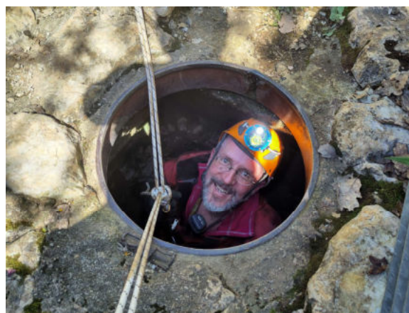
Der Autor beim Ausstieg, RU

Zurück in der Einsturzdoline entschieden wir uns, die Höhle an dieser Stelle mittels Kletterei an der Seitenwand zu verlassen. Querbeet durch das Buschwerk und auf diversen Wegen steuerten wir den natürlichen Höhlenausgang der Peyrejal an. Wir waren gespannt, ob wir vom Ausgang her bis zum Siphon vorstossen könnten, welchen wir am Vormittag bereits schon von der anderen Seite hergesehen hatten. Ein direkt beim Höhlenausgang vorhandener See liess dieses Vorhaben aber scheitern und wir kehrten zum Auto zurück.